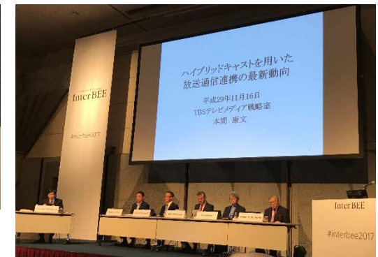
パネルディスカッション風景